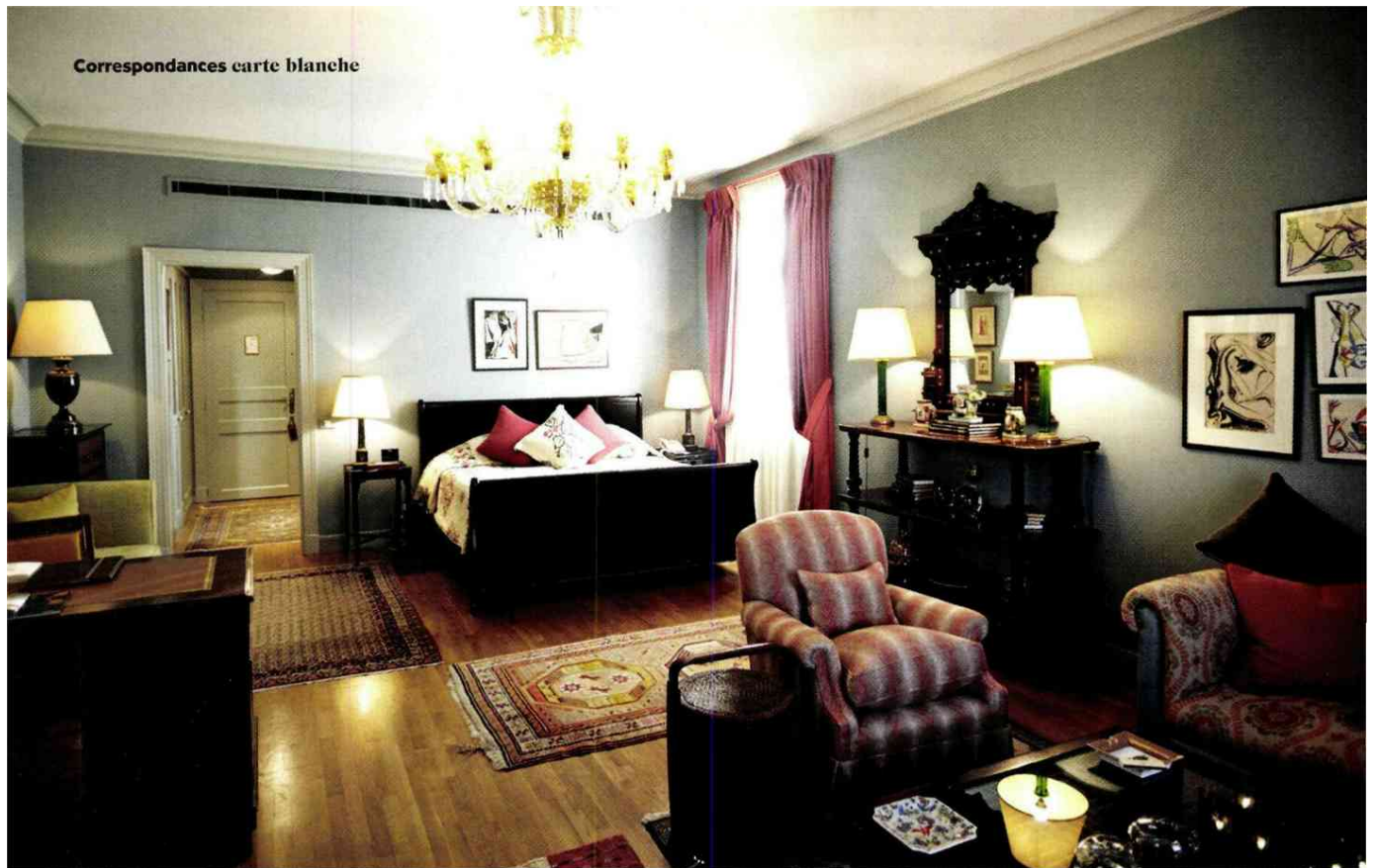
Correspondances carte blanche