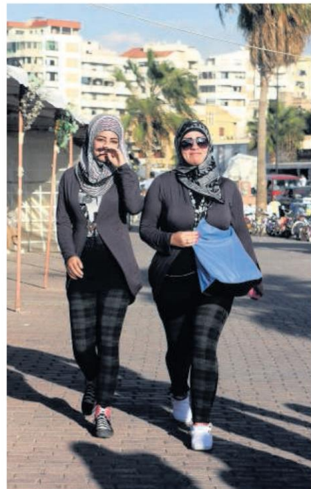
Zevenduizend jaar geschiedenis, veel te zien tijdens dagtrips, prachtige mensen en een keuken die meespeelt in de eredivisie; de populariteit van Beiroet is makkelijk verklaard.